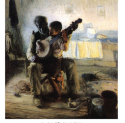
Ceviri: TÖLİN NUTKU